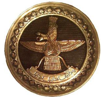
Monotheismus des Zoroaster: Der Gott Ahura Mazda

Eine nicht unwesentliche Rolle spielte im zentralasiatischen Raum die monotheistische Tradition des Zoroastrismus . Dieser Glaube persischen Ursprungs, wanderte auch ostwärts und ist mit seinen Einflüssen entlang der Seidenstrasse zu entdecken. Die Zoroaster, deren zentrales Ritual das heilige Feuer war, und die deshalb auch etwa als „Feueranbeter“ bezeichnet wurden, waren unter den Achämeniden (685 – 330 v. Chr.) stark verbreitet. Zu dieser Zeit war der Zoroastrismus persische Staatsreligion.