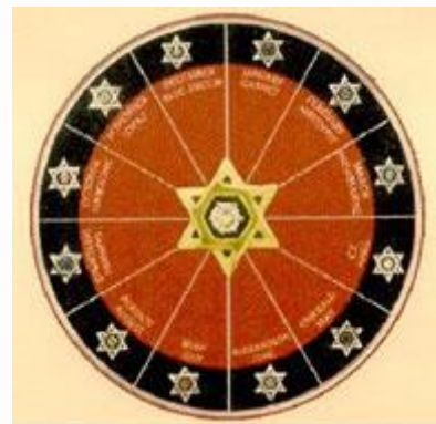
Geburtsstein mit sechszackigem Stern