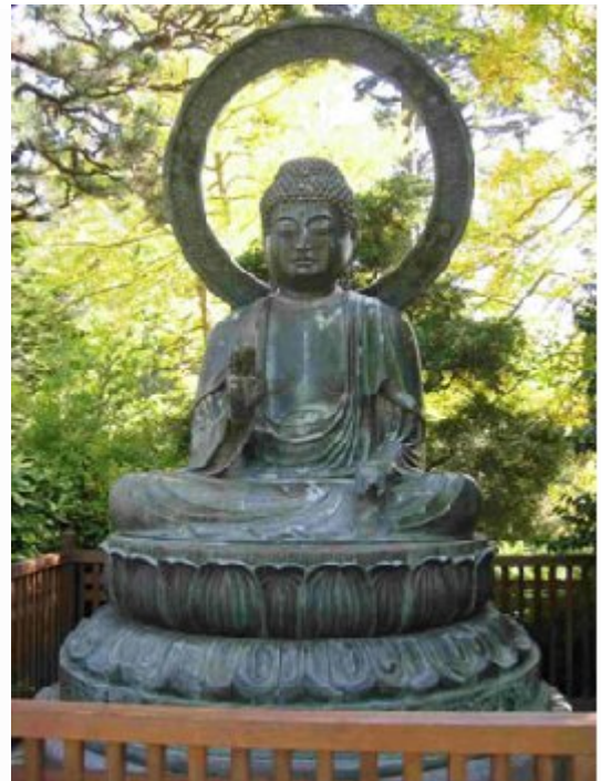
Buddha: Japanischer Tea Garden San Francisco

Für die weltanschauliche Auseinandersetzung wird wichtig sein, ob und auf welche Weise der Dialog mit den verschiedenen Gruppen möglich ist. Wenn ein kritisches Gespräch in weiteren Begegnungen sich ergeben kann, dann ist ein wesentliches Anliegen unserer Reise erfüllt.